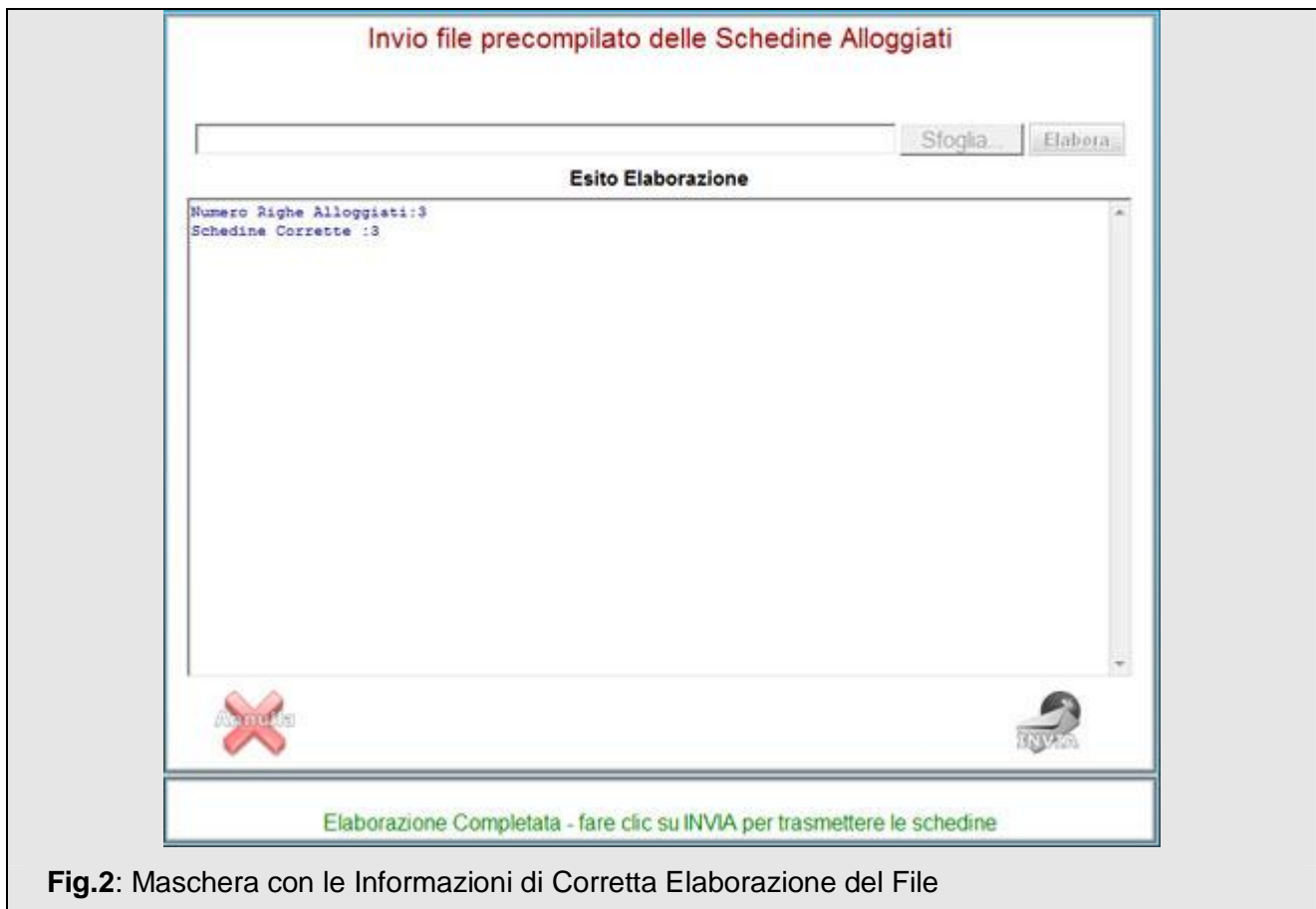
Fig.2: Maschera con le Informazioni di Corretta Elaborazione del File

Nel caso in cui l'elaborazione del file abbia evidenziato errori verrà mostrata una schermata analoga alla seguente che ricapitola il numero di schedine corrette e quello di schedine scartate con i relativi dati anagrafici (cognome, nome e data di nascita) ed i motivi dell'esclusione.